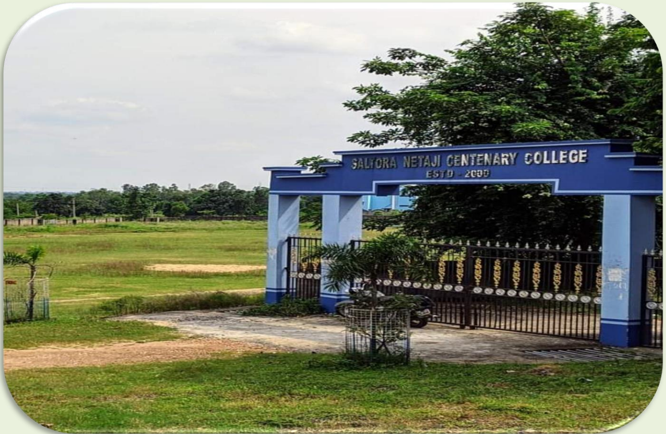
College Main Entrance Gate