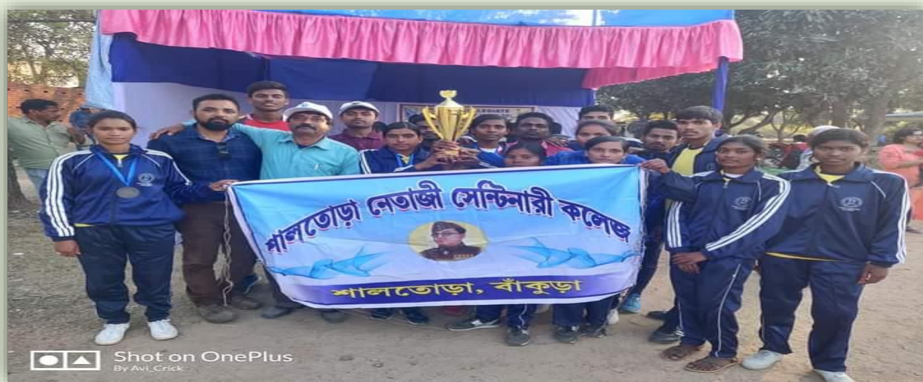
College Champion (Women) in 3rd Inter Collegiate Athletic Meet (2019-20), Bankura University on 16th February, 2020