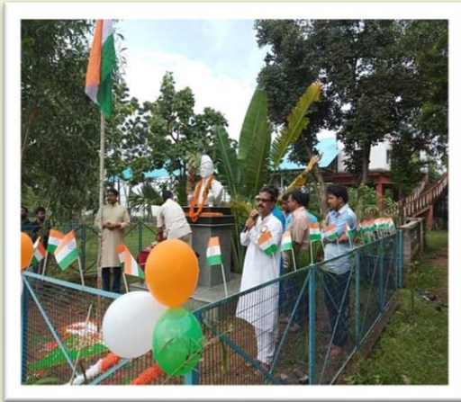
Celebration of Independence Day, 2019