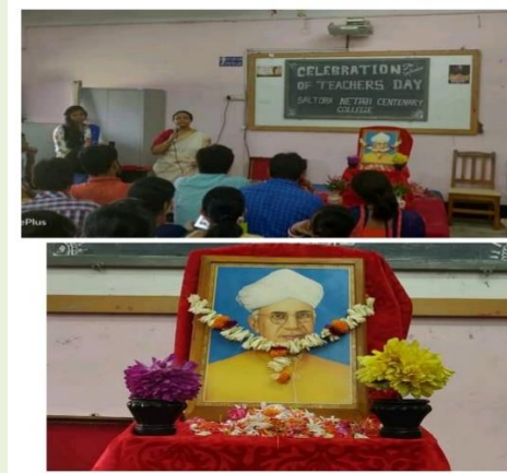
Celebration of Teacher's Day, 2019