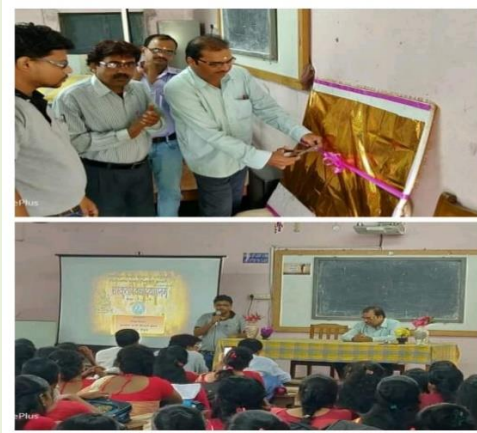
Celebration of World Sanskrit Day & Inauguration of