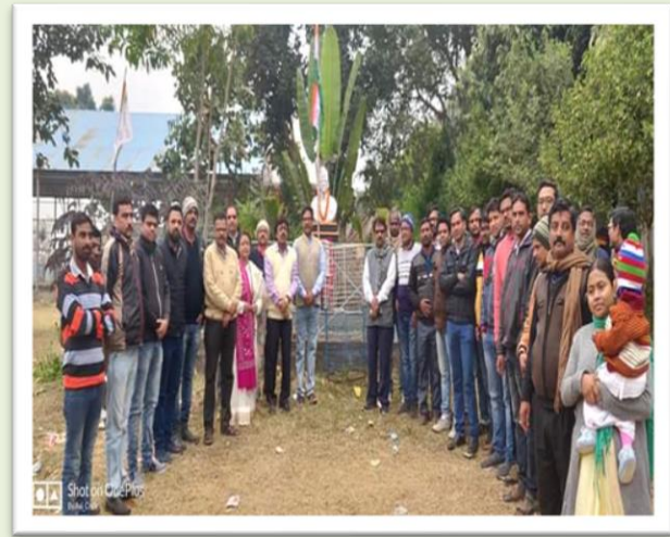
Celebration of Netaji Jayanti on 23/01/2020