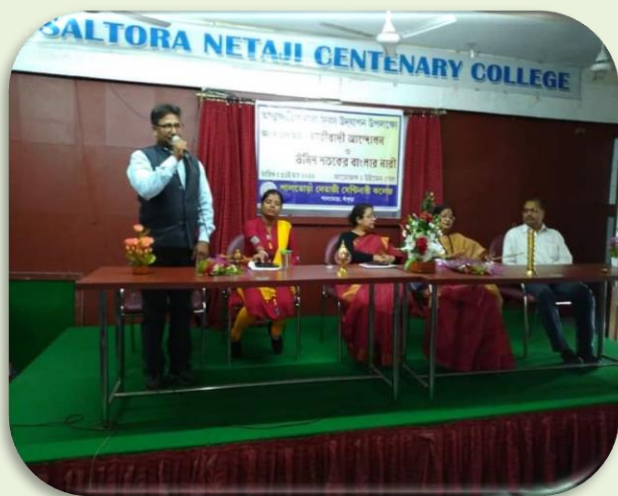
Celebration of International Women's Day on 08/03/2020