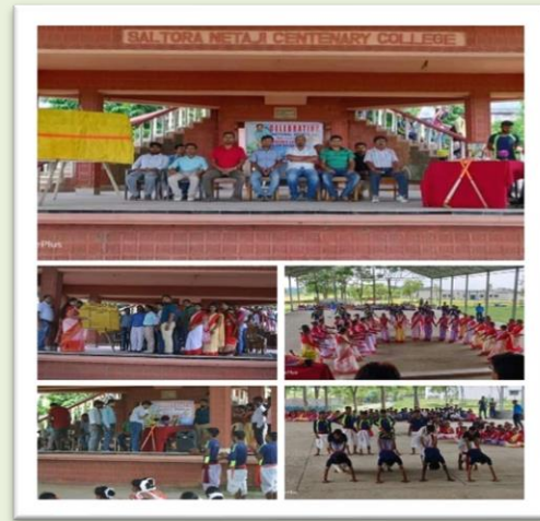
Celebration of National Sports Day & Inauguration of Departmental Wall Magazine Organized by Dept. of Physical Education