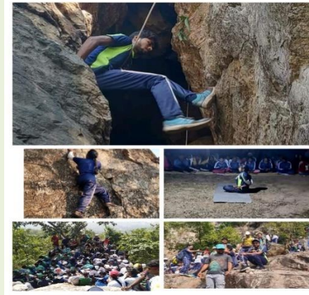
Leadership Training Camp at Susuniya Hills, Bankura Organized by Dept. of Physical Education