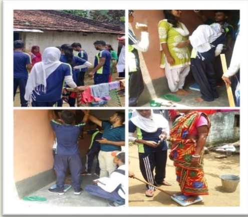
Health Awareness Programme at College Para, Saltora Organized by Dept. of Physical Education