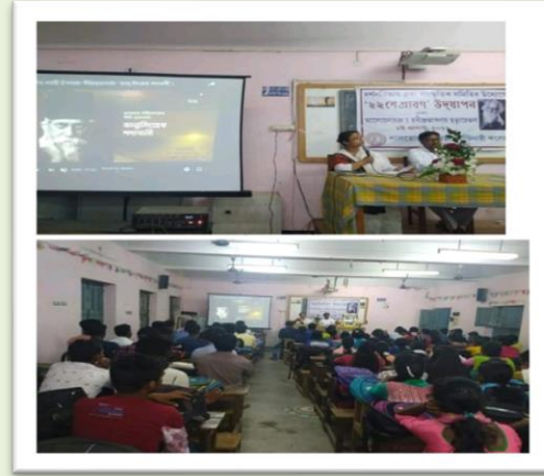
Celebration of 22she Shravan on 08.08.2019