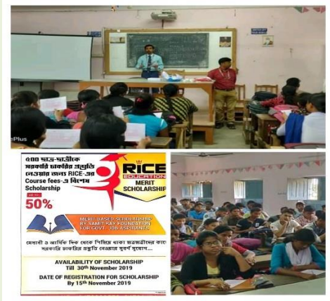
RICE Merit Scholarship Test on 15/11/2019