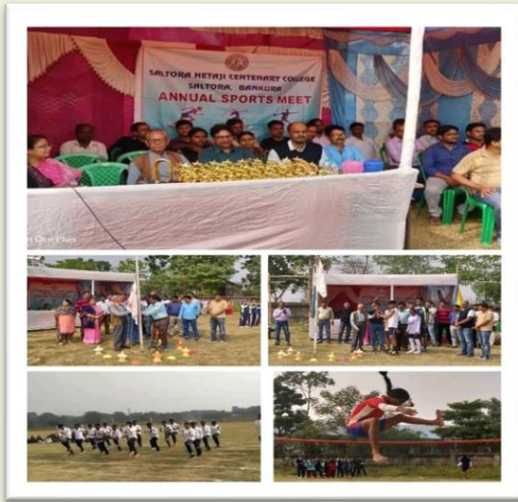
College Annual Sports Meet 2019-20