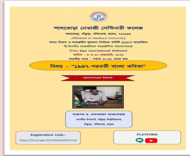
Two Days International Webinar on "১৯৪৭ পরবর্তী বাংলা কবিতা" Organized by Dept. of Bengal in collaboration with IQAAC on 9th & 10th Feb., 2021