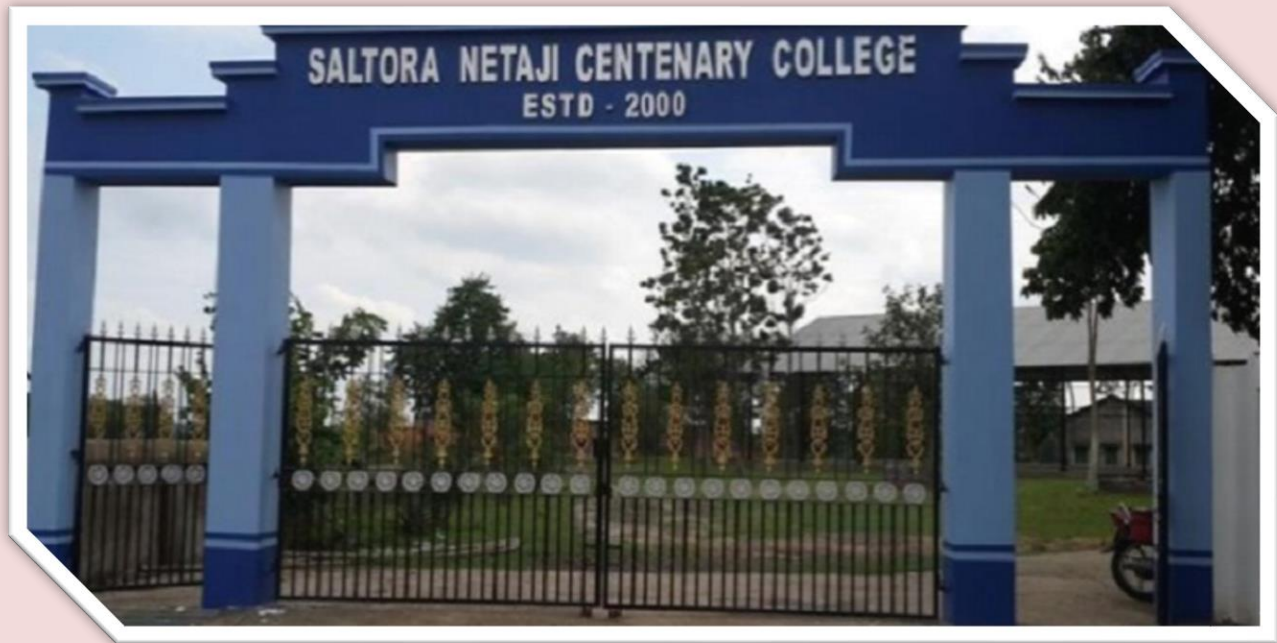
College Main Entrance Gate