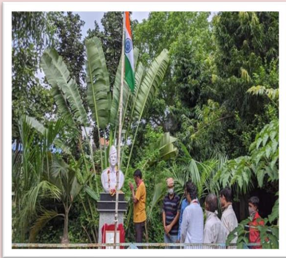
Celebration of Netaji's Birth Day, 2021