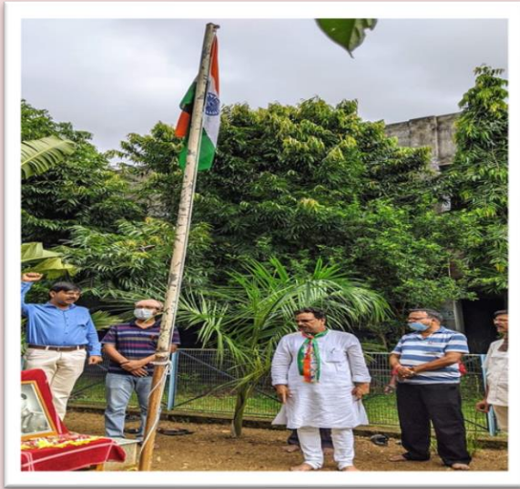
Celebration of Independence Day, 2020